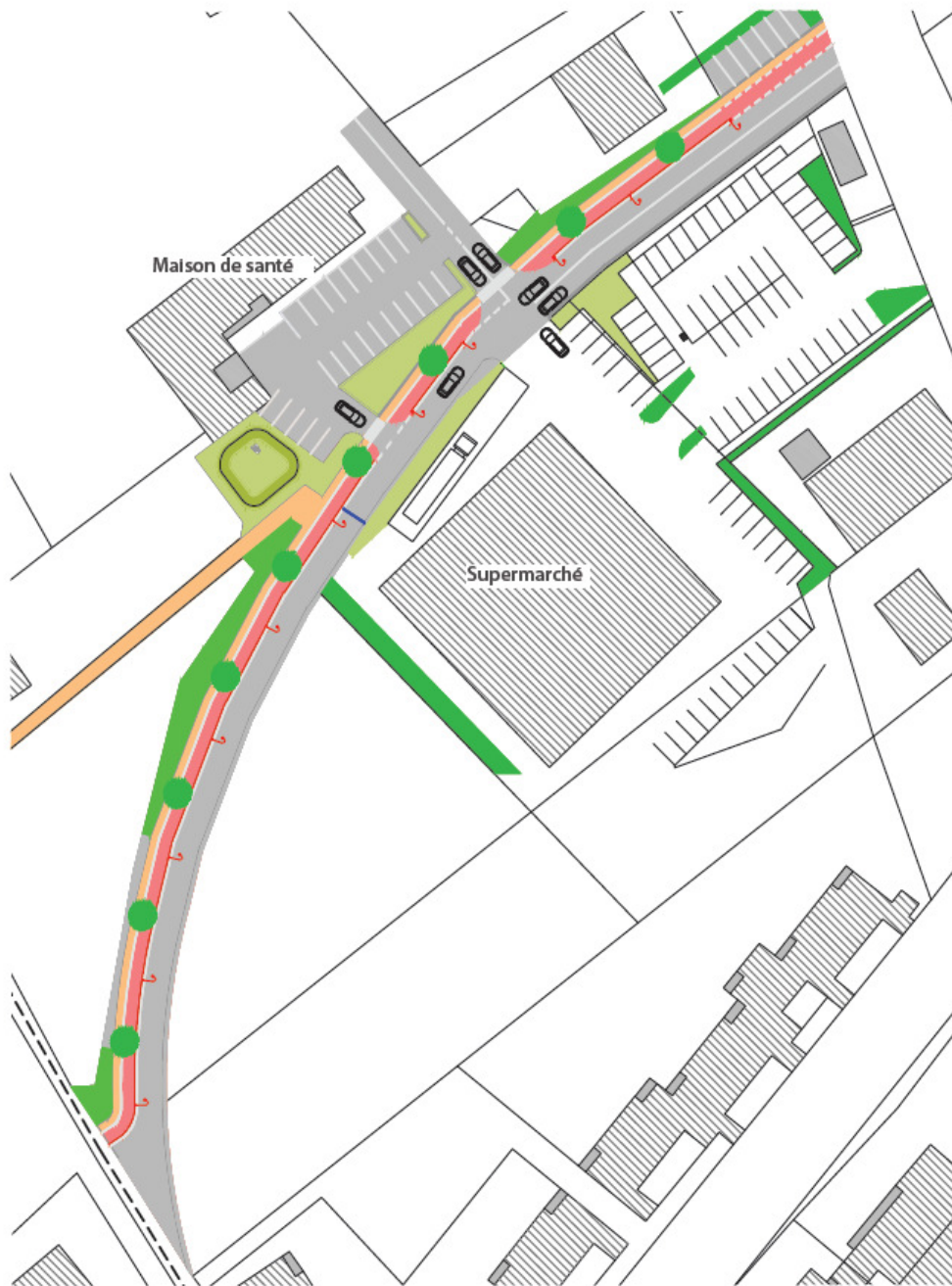
Conseil d'Architecture d'Urbanisme et de l'Environnement de la Meuse - Aménagement du chemin d